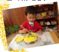
動物になって食べに行くよ。お面制作中！