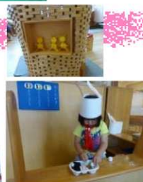
首元にバンダナを巻いて、うさぎの耳がついた帽子を被ったかわいい店員さんがお弁当を販売しています。