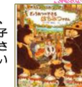
「ぎょうれつのできる はちみつやさん」 作・ふくざゆみこ