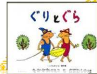
「ぐりとぐら」 作・中川 李枝子 絵・大村 百合子