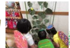
カッパの大好物といえば、きゅうり！収穫できたら、かっぱ巻きを作ろう。