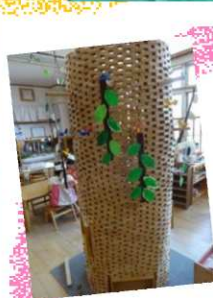
大人気のお店「はちみつやさん」。ホットケーキを頼むと好きなはちみつを選んでかけてもらえます。1番人気は「クローバーのはちみつ」。