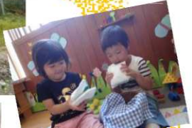
ピーナッツバター、マーマレード、たんぼぼ、クローバ、バセリとセロリ、パンにはさんでぐりとぐらサンド