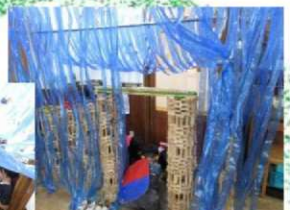
ここはカッパの隠れ家。沢山のカッパたちがやって来てひそひそと何かが行われています。