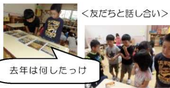
<友だちと話し合い>