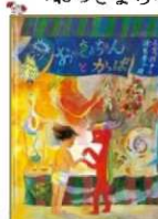
「おつきよちゃんとかっぱ」 文・長谷川 撫子 絵・降矢 奈々