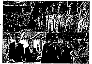
滋賀県警察官募集