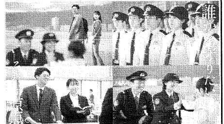
滋賀県警察官募集