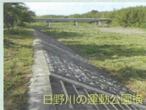
日野川の運動公園横

ます。まずは、地域住民が河川に関心を示し、当委員会では各自治会と協力し災害に強いまちづくりを目指し、皆さんと一緒に活動を進めて行きたいと思いを