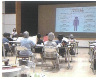
(保健師による講座)