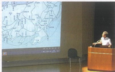
【蒲生コミュニティセンター】

次回以降も多彩な内容の講座を予定しています。興味のある回だけの受講もできますので、多くの方の受講をお待ちしています。