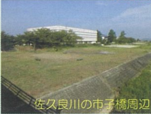
佐久良川の市子橋周辺