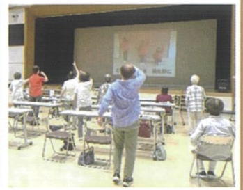
(蒲生まち協音頭で体操)