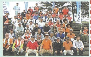
蒲生地区まちづくり協議会 (ふるさと蒲生野川づくり委員会)

ます。まずは、地域住民が河川に関心を示し、当委員会では各自治会と協力し災害に強いまちづくりを目指し、皆さんと一緒に活動を進めて行きたいと思いを