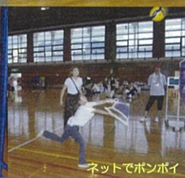
ネットでポンポイ

編・集・後・記 『わが街に「コストコ」がやってくる』そんなニュースが飛び込んできたのは約3年ほど前だろうか。当時は近隣の店舗へ行くか、オンラインでの買い物をするか、近隣の店舗とはいえ県外のため、ちょっとした日帰り旅の気分が出ていたものがまさかわが街にくるとは夢にも思わなかった。市長の話だと、8年ほど前から誘致をしていたとのこと。それもまた驚きの話である。造成工事のち、建築工事が始まり、現場がどんどん進んでいくにつれ、ワクワク感がどんどん増していった。そして、いざオープン当日。定刻より3時間前倒しの午前5時オープン。先頭には3日前から並んでいたという県外の方もおられたとか。多分にもれず駐車場が満車のため断念したがオープン5日目には再度行ってみた。駐車場へは入り入れたものの、店舗内へ入ってみると夏休み終盤ということもあり、大勢の家族連れであふれかえっていた。ゆっくり見ようとしてみたが、あまりの人の多さに圧倒されお目当ての商品のみ購入しただけで買い物を終えた。店内では定番の試食コーナーが、オープン直後ということもあってか他店よりも充実していた。店内の至るところに行列ができていた。東近江倉庫店限定の商品もあってのことだが、まだ見つけられず。次回ゆっくり見て回ろうかと思っている。コストコができたことにより、県内外から多くの方が東近江市に来られるということも、交通渋滞など地元住民の方はいらうと危惧されることもあるかとは思いますが、これをきっかけに地域の活性化につながればうれしく思う、今日この頃である。(え)