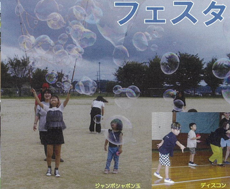
ジャンボシャボン玉