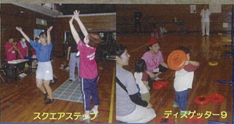
スクエアステップ