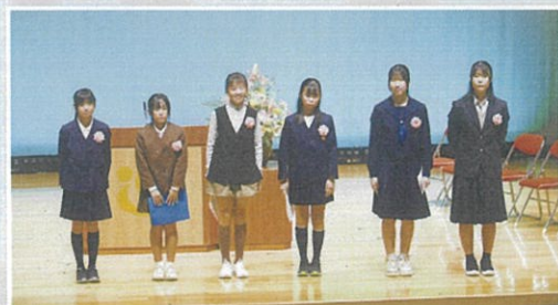
青少年の主張発表