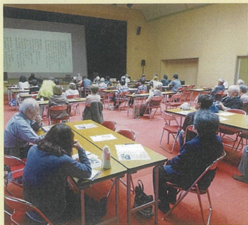
会場の様子(上)とロビーでの健康チェック風景(右)

*医療・福祉専門職による、健康チェックコーナーも設置しています。 *次回は、3月6日(木)に開催します。