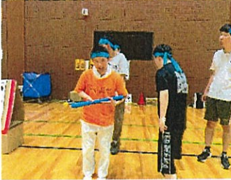
お笑い隊長 選手宣誓!