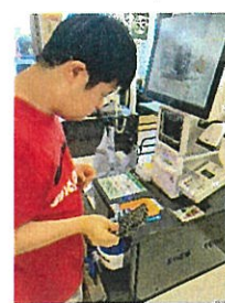
セルフレジ 緊張する〜