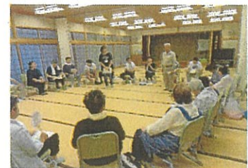
大塚町自治会老人会様との交流活動(地域貢献事業)