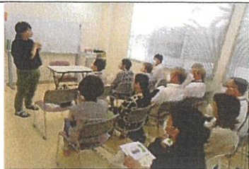
蒲生地区民生委員児童委員施設説明・見学会