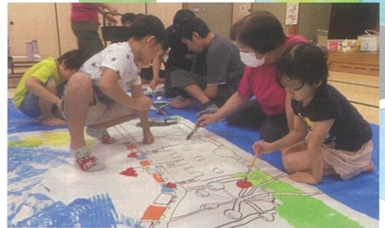
この作品は“ことうふるさとまつり”に展示します

ぜひ来年は、皆さんもサマーホリデーのボランティアにご協力ください。詳しくは東近江市社会福祉協議会地域福祉課（電話 0748-20-0555）までお問い合わせください。