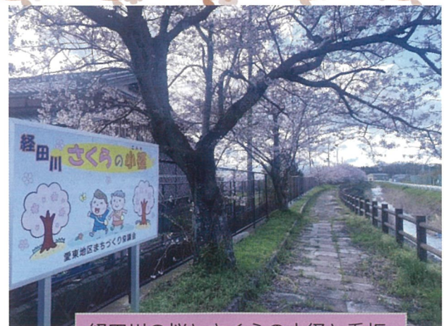
経田川の桜とさくらの小径と看板