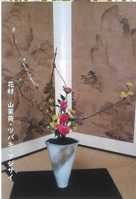
花材 山茱萸・ツバキ・アジサイ

今月は山茱萸(サンシユユ)です。サンシユユは朝鮮半島及び中国を原産とするミズキ科・ミズキ属の落葉広葉高木です。日本には江戸時代から庭木として各地に植栽されました。3〜4月に春を告げるように黄色い花を咲かせ、別名ハルコガネバナ(春黄金花)とも呼ばれます。花は小さいですが、集まって咲くのでとても華やかです。春に黄色い花を咲かせたサンシユユは秋になるとグミに似た鮮やかな赤い実を実らせませす。漢方では果実を山茱萸(サンシユユ)と呼び、滋養・強壮・強精・収れん・止血などに効果があるとされ八味地黄丸などに処方されています。花言葉は「強健」「持続」「耐久」「気丈な愛」です。参考: GreenSnapSTORE H.A