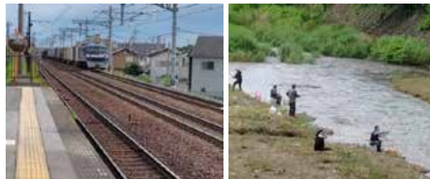
蒲生地区まちづくり協議会(広報企画委員会)

さて、駅名の由来となる芹川へは、歩いて4、5分。上芹橋に到着。大きな中州では数人の人が釣りを楽しんでいる。鮎が釣れるのかな？