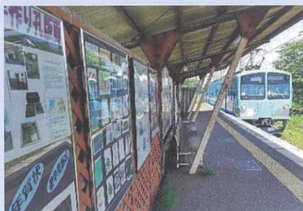
【蒲生地区まちづくり協議会】