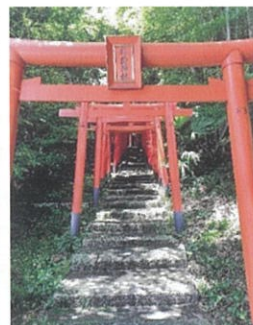
蒲生地区まちづくり協議会(広報企画委員会)