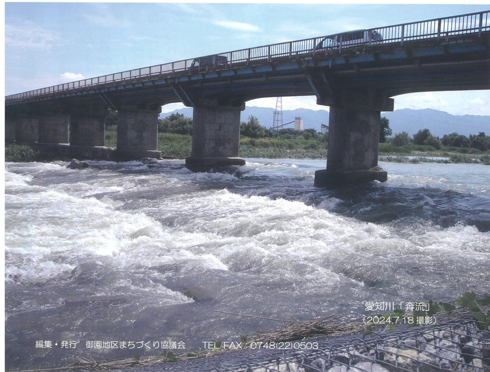
愛知川「奔流」 (2024.7.18 撮影)