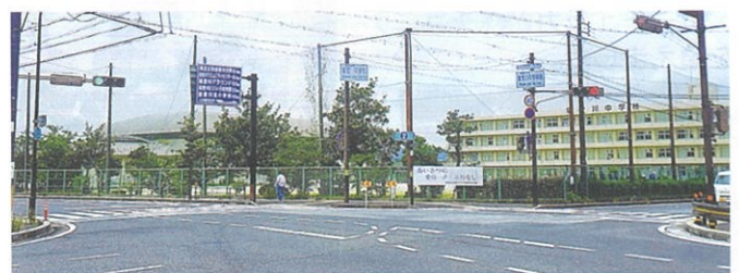
現在 [1972(昭和47)年 信号設置]