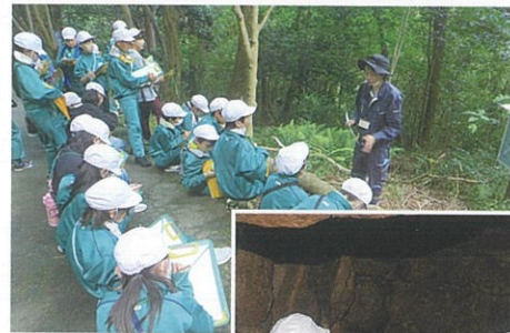
埋蔵文化財センター職員による古墳の説明