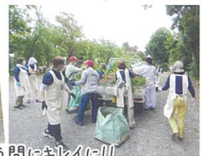
大人数で一斉に行う作業は、あっという間にキレイに!!!