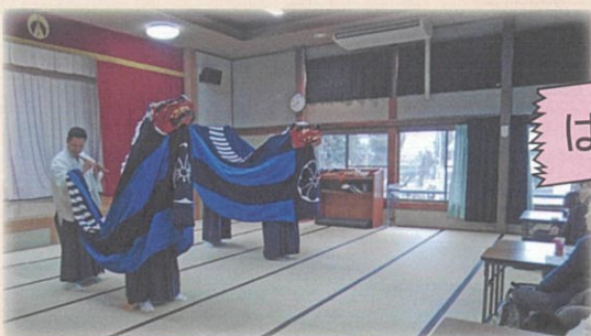
令和6年1月18日獅子舞鑑賞

「はまのサロン」は地域の人々に支えられて8年目を迎えました。毎月第2木曜日、浜野会館の百畳大広間は、健康寿命延伸を目指して「元気な声と笑顔」が一杯です。