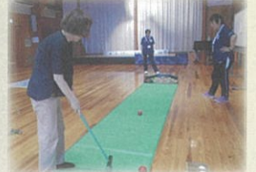
結構むずかしいスカットボール

元号は古代中国で始まり、東アジア諸国へ伝播した。だが、現在では日本のみが踏襲する。日本の元号は、大化の改新で有名な[大化]から[令和]まで 248 回を数える。一方、天皇は神武天皇以来、令和の天皇まで 126 代と元号数が大きく上回る。平成改元時に改訂された元号法により、皇位の継承があった場合のみ改元することになったが、以前は代始改元の他にも吉兆の出現時、災異の長期化時にも改元が繰り返された。248 回の元号について、使用された漢字を数えてみる。元号は通常 2 字の漢字から成る。だが、奈良時代に 4 漢字の元号の時期が 5 回あったので、元号を構成する漢字数は (248 \times 2 + 5 \times 2) = 506 字である。しかし、実際の使用は 73 字のみである。