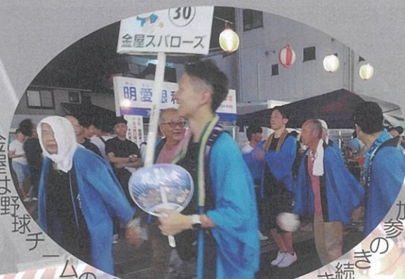
金屋は野球チームのプラカードで去年に引き続き参加した