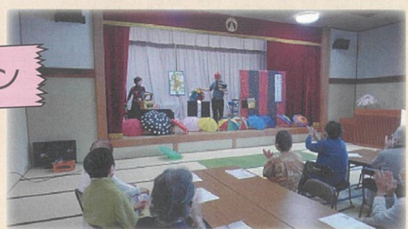
令和6年度オープニングマジックショー