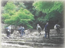
安土城址へのサイクリング & ハイキング

八日市ひだまりサロンは平成 25 年 11 月に開設、今年で 11 年目になります。毎月第 3 火曜日に、「参加者が主役」「帰るときは笑顔で」楽しく集っています。