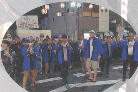
常連の地元浜野総自治会