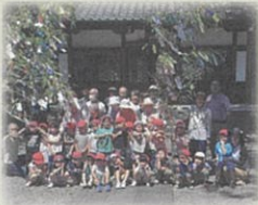
めぐみ保育園園児たちとの七夕まつり