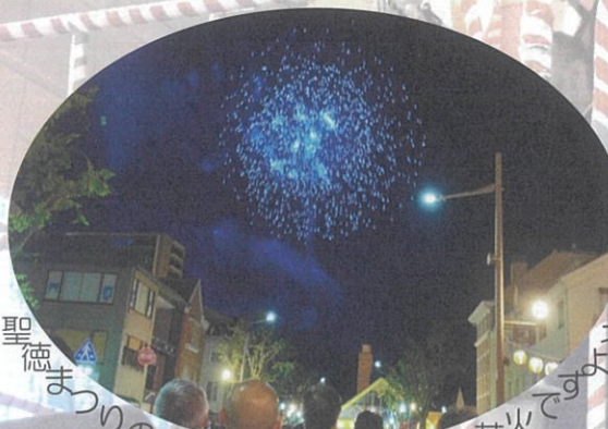
聖徳まつりのフィナーレはやっぱり花火です