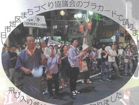
まちづくり協議会のプラカードで踊りました 飛び入り参加もあり楽しく踊りました