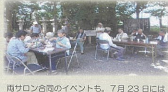
両サロン合同のイベントも。7月 23 日にはソーマン流しを企画しましたが、コロナの流行で断念、個別にいただきました。