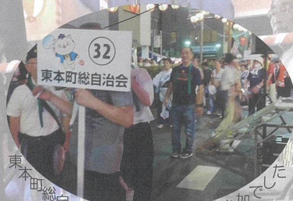
東本町総自治会は自治会として初参加でした

清水町いきいき夏まつり（自治会主催）が、7月28日夕方から清水会館前の駐車場広場で行われました。