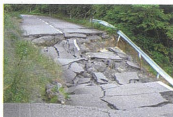
地震発生後の道路

10名で、5月31日から1泊2日で現地入りしました。初日は能登島の海岸に流れ着いたごみ拾いと、イベント会場予定地の草刈りでした。2日目は地元ボランティアさんと、町内のごみ拾いに参加しました。地元の方の参加は子どもさん含め50名程度でした。お昼は手作りカレーをいただき、当時の様子を聞かせてもらい、実際に災害に直面した怖さを改めて知ることができ、自然災害への備えや意識を再認識しました。また、自分の命は自分で守ることが大切だと強く感じました。復興が進まない中ですが、地元の方は前向きな考えで日常生活を送っておられます。それは地域の絆が強く、まさに自助・共助・近助の精神でした。