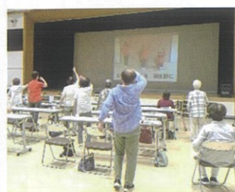
(蒲生まち協音頭で体操)