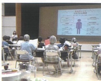
(保健師による講座)