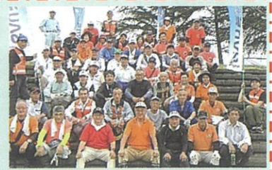
蒲生地区まちづくり協議会 (ふるさと蒲生野川づくり委員会)

ます。まずは、地域住民が河川に関心を示し、当委員会では各自治会と協力し災害に強いまちづくりを目指し、皆さんと一緒に活動を進めていきたいと思ひます。