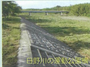
日野川の運動公園横

ます。まずは、地域住民が河川に関心を示し、当委員会では各自治会と協力し災害に強いまちづくりを目指し、皆さんと一緒に活動を進めていきたいと思ひます。