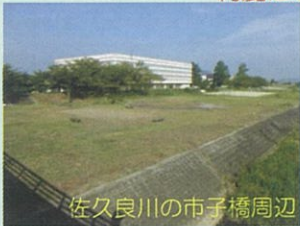
佐久良川の市子橋周辺