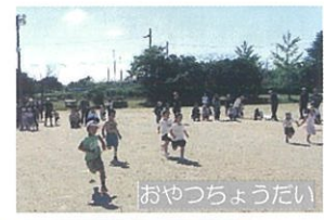
おやつちょうだい