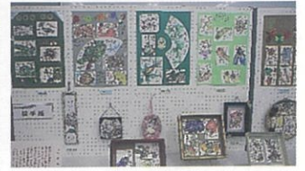
【蒲生地区文化祭実行委員会】