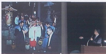
【蒲生コミュニティセンター】

今年度は、今回で終了となりました。多くの方に受講していただき、ありがとうございました。次年度も皆さんに興味を持ってもらえるような多彩な内容の講座を考えています。多くの方に受講していただきますようお願いいたします。