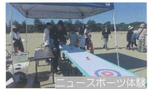
ニュースポーツ体験