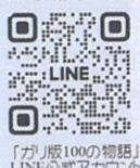
「ガリ版100の物語」 LINE公式アカウント