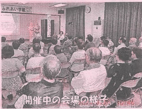
開催中の会場の様子