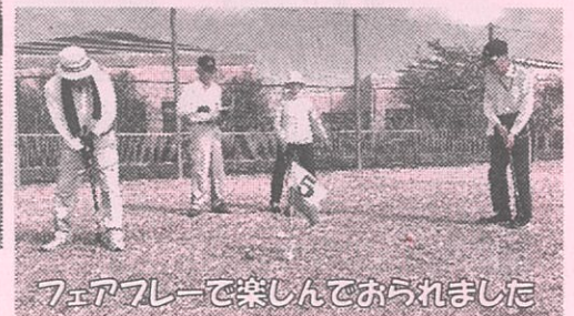
フェアプレーで楽しんでおられました