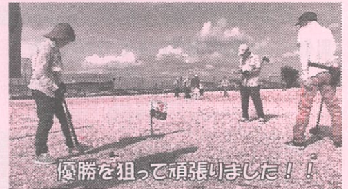
優勝を狙って頑張りました!!