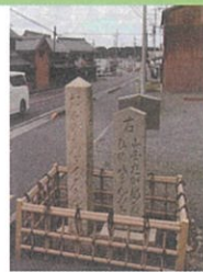
土山宿(東海道と御代参街道の分岐点)